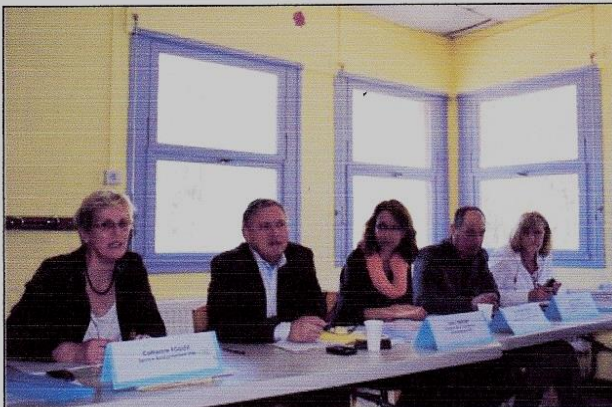
Les représentants de TPM et des mairies de Six-Fours et La Seyne consultent les usagers